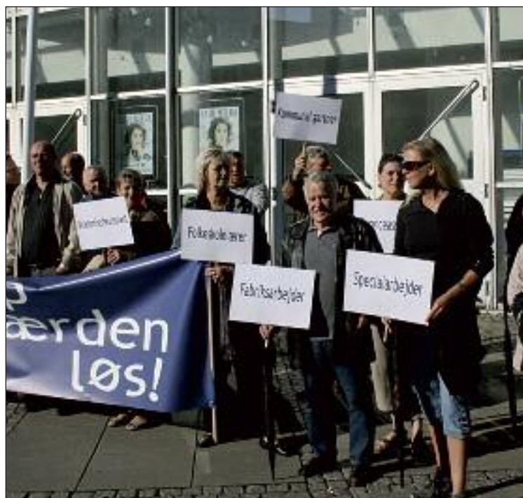
Fagbevægelsen har tidligere i 2007 advaret Kommunernes Landsforening og regionerne om konflikt, hvis ikke forhandlingerne giver et godt resultat.

Forbundet har netop udsendt strejkevejledning, så hvis du har konkrete spørgsmål til hvordan du er stillet - f.eks. med afvikling af ferie eller afspadsering eller andet i tilfælde af en konflikt, er du velkommen til at ringe i afdelingen.